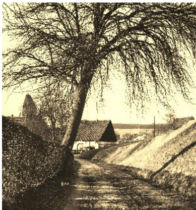
Der Birnbaum von August Wiegand neigte sich in der Tat über den Landweg

nich so genau. Weeichands August waß auken Oulenköeken un ouden Duarpe nich wächtodenken. Wenne in seeine Backstuarben derbe schweiden mosse, dann leip häeh äerst no „Kitthiarm“ un gaut sicken paar achter de Binde. De Deig anne Hänne stöhr äen dobeej nich. Wenne dann 'n paar Dönnkes reiden kann un sick vohahlt hadde, konne weeiha onnik kniarn. Vandage kammen da aule Hous blaut no ubben Belle seein. De nigge Besitzer hat olles nigg bobbt un grödder uptourgen.