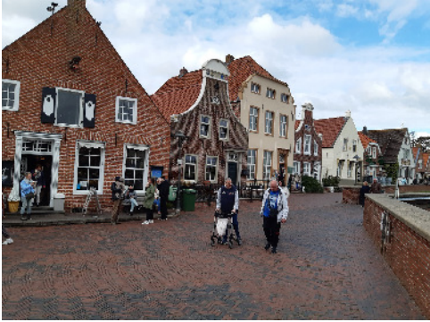
Greetsiel alter Sielhafen

Weiter führte uns die Fahrt durch verschiedene Dörfer in der Krummhörn bis zum Fischerdorf Greetsiel. Greetsiel wurde als Sielort zum ersten mal 1388 erwähnt. Die reformierte Kirche, zwischen 1380 und 1410 erbaut, die Zwillingsmühlen, das Cirksena5-Steinhaus, das alte Sielort und die Sielstraße mit der am Hafenbecken gelegenen Häuserzeile gehören zu den Hauptsehenswürdigkeiten in Greetsiel.