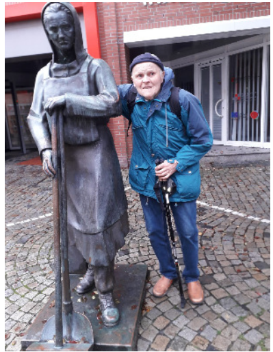
Erwin und die Peterke

Ich habe mit meiner Frau eine Busreise in das schöne Ostfriesland mit dem Heimatverein Dornberg unternommen. Dabei sind wir auch in der Nähe des Otto-Hauses in Emden auf eine Bronzestatue in einer Einkaufsstraße gestoßen. Die Statue stellte eine ältere Frau mit Besen und Schaufel dar. Sie sah etwas verhärtet aus. Eine freundliche Passantin klärte uns auf. Das sei die „Peterke“ (von 1882 bis 1957). Jeder würde sie in Emden kennen. Die Frau war nach dem Krieg allein mit ihren drei Kindern. Ihr Mann war nicht zurückgekommen. Sie hat die Bürgersteige und die Straße der anderen gefegt und dafür etwas Geld bekommen, um sich und die Kinder und eine kranke Schwester durchzubringen. Sie war trotz ihres harten Lebenskampfes ein freundlicher Mensch geblieben. Es ist doch gut zu wissen, dass nicht nur Kaiser, Könige, Heerführer und Bundespräsidenten ein Denkmal bekommen, sondern auch diese Straßenkehrerin.