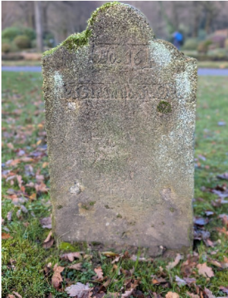
Alter Grabstein der Wiegands auf dem Dornberger Friedhof. (neben der Schutzhütte)

einem Laden eingerichtet. Für die Bäckerei, die älteste im Dorf, wurde hinter dem Fachwerkhaus ein Anbau errichtet. An der Hecke stand ein dicker Birnbaum, der ziemlich schräg über den Weg ging. Hier suchte jeder sich davon auf und alle im Dorf konnten Wiegands Birnen schmoren. August nahm das nicht so genau. Wiegands August war auch ein „altes Küken“ und aus dem Dorf nicht wegzudenken. Wenn er in seiner Backstube schwer ins Schwitzen kam, dann lief er erst zu „Kitthiarm“ (der damalige Wirt des Gasthauses Am Tie, das heutige Tomatissimo. Der Wirt Hermann Generotzki war äußerst vielseitig: er war nicht nur Gastwirt, sondern auch Landwirt, Kaufmann, Trichinenbeschauer und Glaser, vom letzten Beruf stammt sein Spitzname) und goss sich ein paar hinter die Binde. Der Teig an den Händen