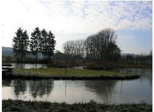
Oberwittlers Mühlenteich