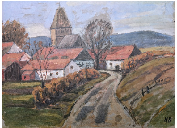
Aquarell von Hermann Diestelhorst.

Unser Untervogt Lanversiek hatte sich auf seinen sogenannten Vrogezetteln alles aufgeschrieben, was die Dornberger wohl nicht richtig gemacht hatten. Da wurde zweimal im Jahr in der sogenannten Brüchtekammer Gericht gehalten. Ehrenamtliche Bauernrichter waren den