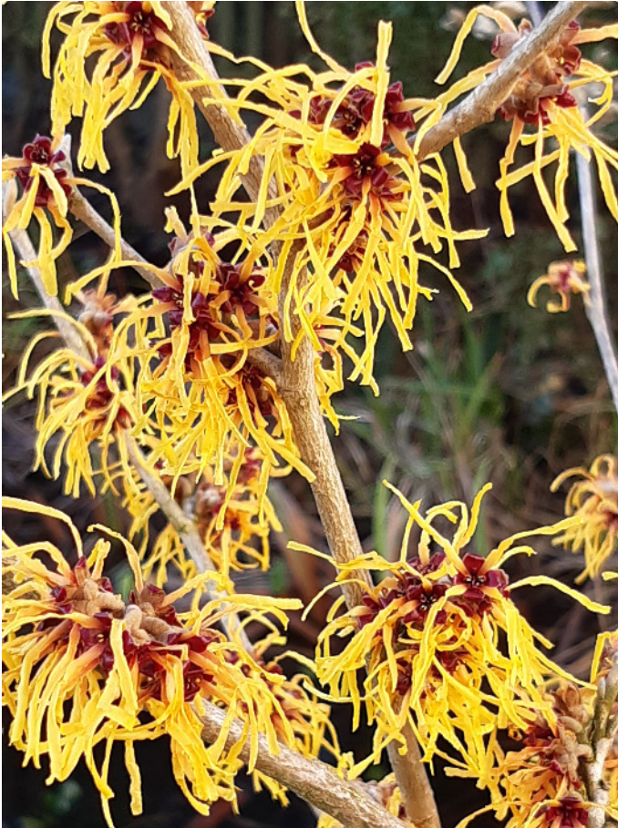
Die Zaubernuss