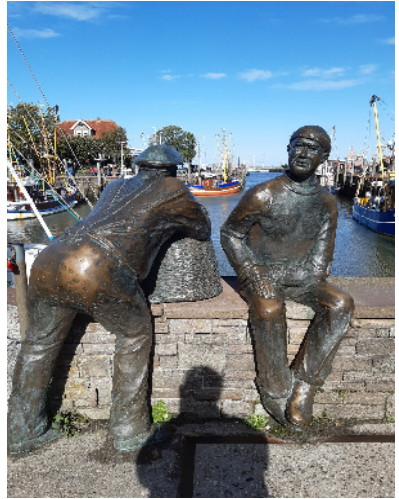
Neuharlingersiel Fischereihafen mit Skulpturengruppe "Alt- und Jungfischer"

Neuharlingersiel ist um 1693 entstanden und ein bekannter Hafen für die Hochseefischerei. Viele Frachtschiffer erkannten die vorteilhafte Lage, um von dort aus die verschiedenen Handelshäfen der Nord- und Ostsee anzulaufen. Nach einem ausgiebigen Hafen- und Deichrundgang hatten wir dann noch Zeit gemütlich einen Kaffee oder Tee zu trinken.