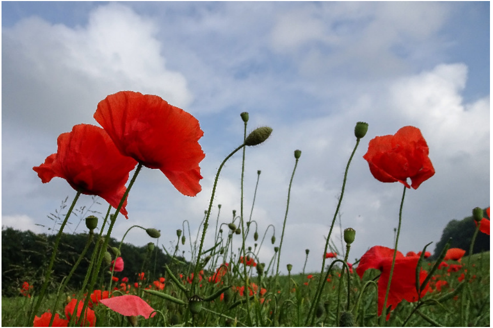
Mohnblumen am Linkberg