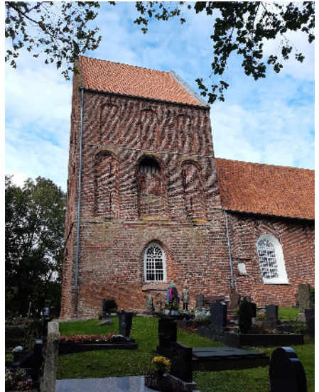
Der Kirchturm von Suurhusen

Als Sehenswürdigkeit fällt vor allem die Kirche mit dem schiefsten Turm der Welt auf. Wir bekamen hier eine sehr humorige Kirchenführung von einem ehemaligen Kapitän, der jetzt dort dem Heimatverein angehört. Die Mitglieder kümmern sich um die Erhaltung der Kirche und des Friedhofs. Der „Kapitän“ erklärte uns, dass die ursprünglich 32 m lange Kirche im Jahr 1450 um ein Viertel gekürzt wurde. Darauf wurde dann der Turm auf Eichenstämmen errichtet. Durch eine Grundwasserabsenkung kam Luft an die Eichenstämmen, die als Folge davon verfaulten und sich dadurch der Turm senkte. Zum Abschluss erzählte uns der Kapitän noch, was es mit „Marinekartoffeln“ auf sich hatte: