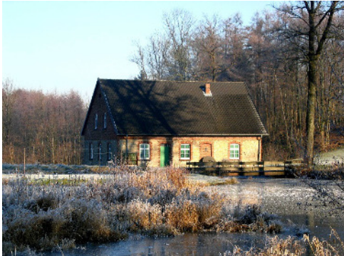
Oberwittlers alte Mühle am Johannisbach

„Ist der Ravensberger Bauer noch nicht so aufgeklärt, als er sollte; so ist ers doch Vergleichungsweise schon mehr, als der Bauer in vielen andern deutschen Provinzen, wo man aufgeklärter zu seyn wähnt, als in Westphalen. Wir haben manchen Bauern, der durch eigenes Nachdenken