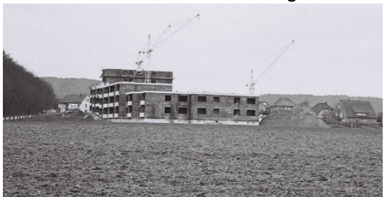
Baugebiet im Vulsiekshof