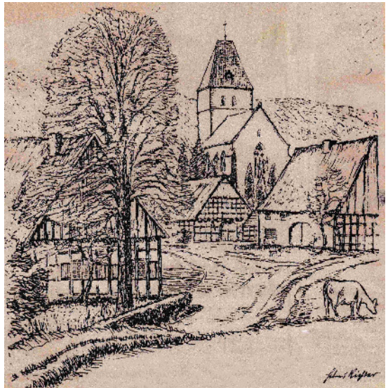
Radierung Gerhard Richter. In der „Fischerstadt“