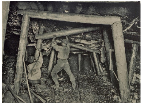
„Untertage in Dornberg“ 1894