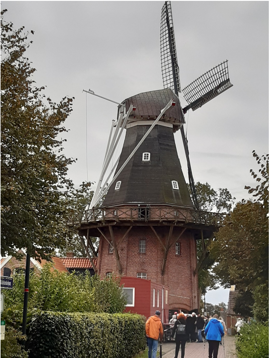
Die Windmühle von Rysum auf der höchsten Stelle der Rundwarft. In unmittelbarer Nachbarschaft zur Kirche