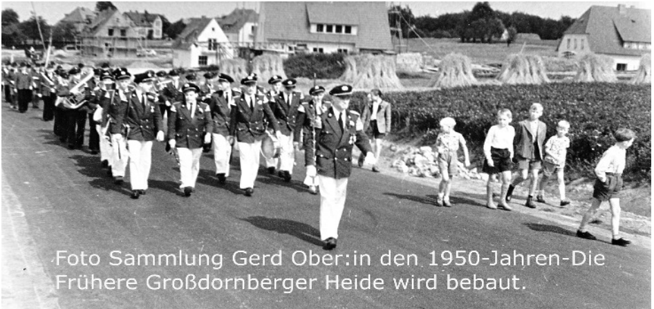
in den 1950-Jahren-Die Frühere Großdornberger Heide wird bebaut.

Kötter Stelle in früherer Zeit als „ Heinbauern “ bezeichnet wurden. Auch das Gebiet um die heutige Zittauer Straße hieß früher mundartlich „ Inne Hein “ „