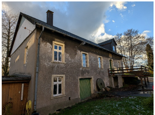
Die Mühle von 1901