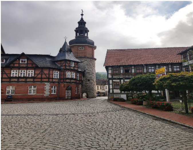
Stolberg: Saigerturm am Eingang zum Marktplatz

Weiter ging die Fahrt zum Südrand des Harzes nach Stolberg.