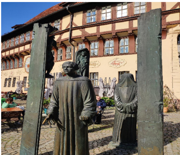
Thomas Müntzer Denkmal in Stolberg