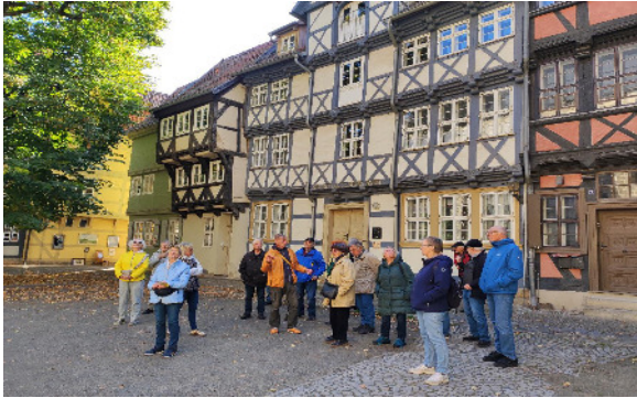
Uralte Kopfsteinpflaster und Fachwerkhäuser aus acht Jahrhunderten prägen das Stadtbild