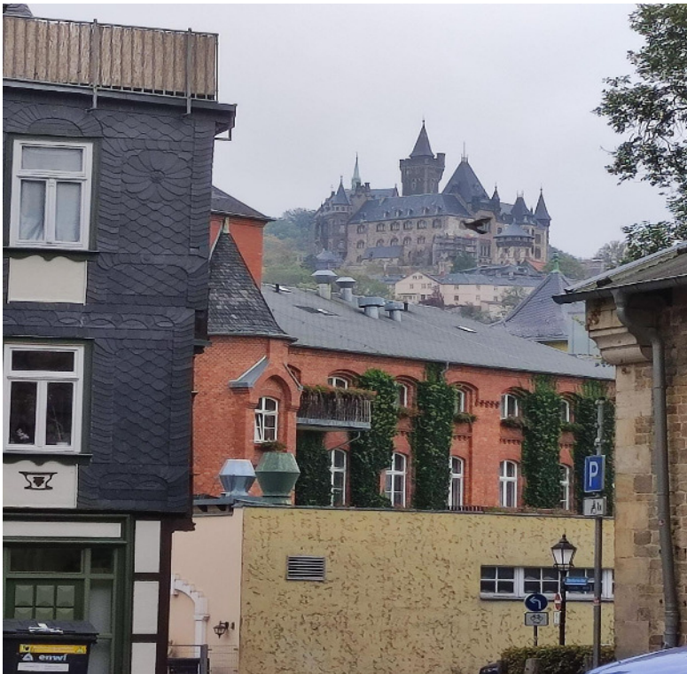
Wernigerode Blick zum Schloss

Alternativ fuhren wir mit der Bimmelbahn hoch zum Schloss mit Schlossbesichtigung.