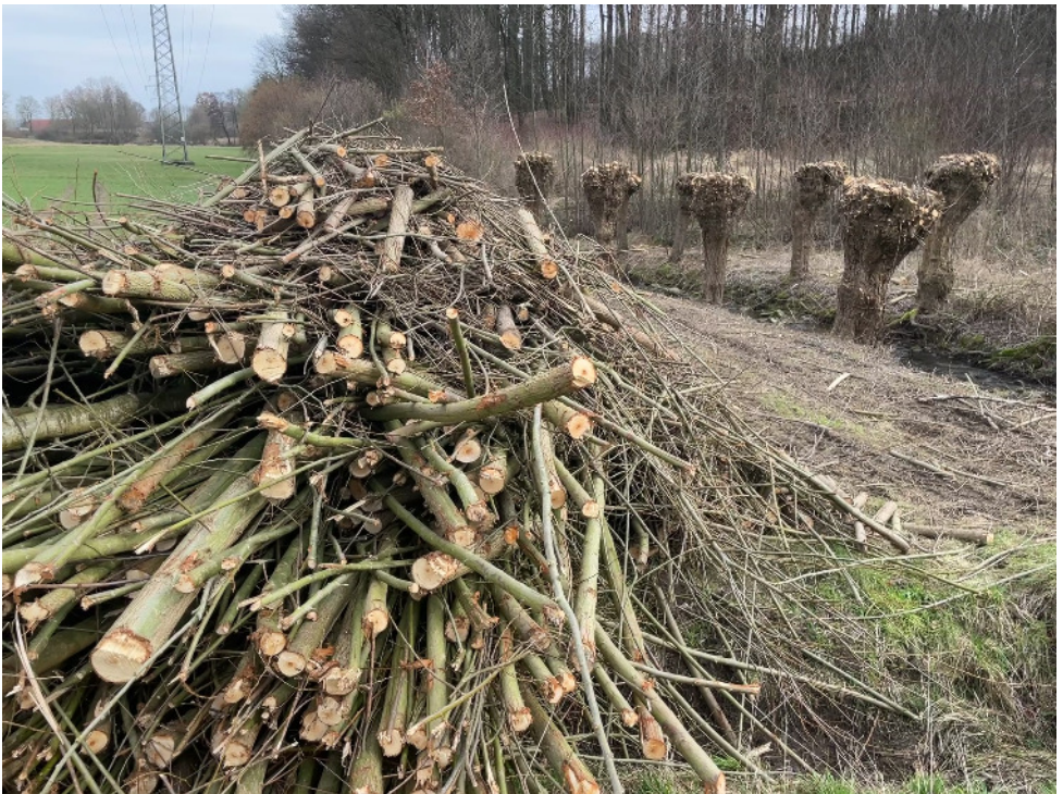
Kopfweiden am Twellbach